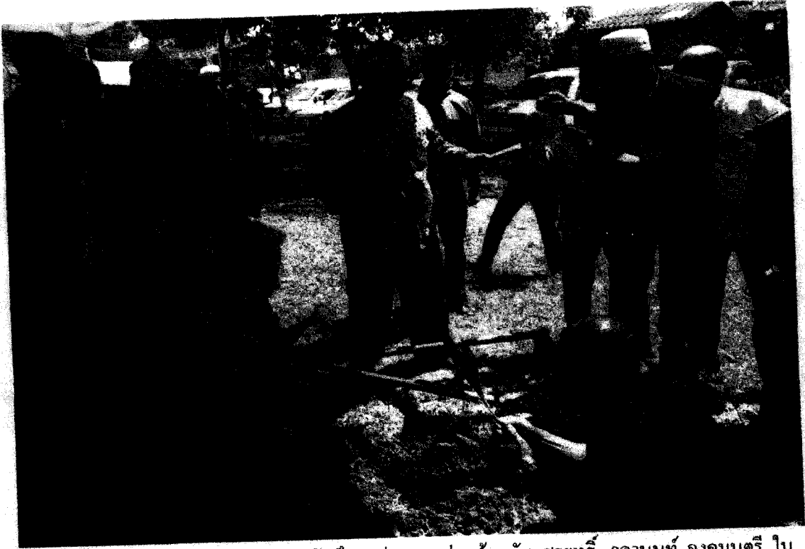
นายฮัมคาลาวิ บือแน โตะครูสถาบันศึกษาปอเนาะ ร่วมต้อนรับ สุรยุทธ์ จุลานนท์ องคมนตรี ใน งานเฉลิมฉลองประจำปี ณ สถาบันศึกษาปอเนาะ อำเภอยะรัง