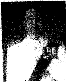
ศาสตราจารย์อุดม รัฐอมฤต รองอธิการบดีฝ่ายกิจการพิเศษ มหาวิทยาลัยธรรมศาสตร์